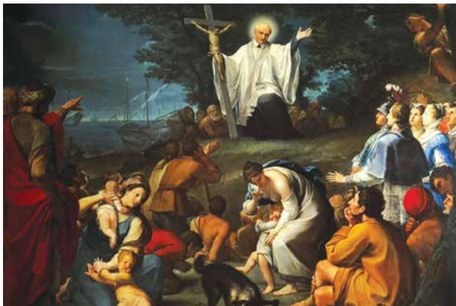
Predica di San Vincenzo de' Paoli di Giacomo Zoboli

Con l'opera dell'artista bolognese Aureliano Milani si realizza il primo grande capolavoro italiano sul Santo: la pala d'altare eseguita, dopo la beatificazione del 1729 per la distrutta Chiesa vincenziana di Montecitorio a Roma, in cui Vincenzo viene ritratto durante una predica all'aperto nella luminosa campagna romana, di fronte ai fedeli in atto di ascoltarlo. Altri filoni iconografici e tematici che si potevano leggere nel percorso dell'esclusiva mostra, li abbiamo ammirati nella tela del modenese Fran-