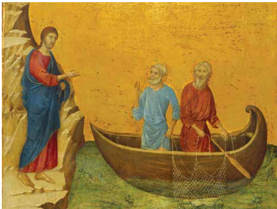
DUCCIO DI BUONINSEGNA, Vocazione di Pietro e Andrea , tavola dalla predella della Maestà, 1308-1311, Washington, National Gallery of Art.

Il ruolo della Chiesa in questo è fondamentale. Abbiamo bisogno che dal sinodo esca una risposta: "Gesù è lì, seguitelo". ■