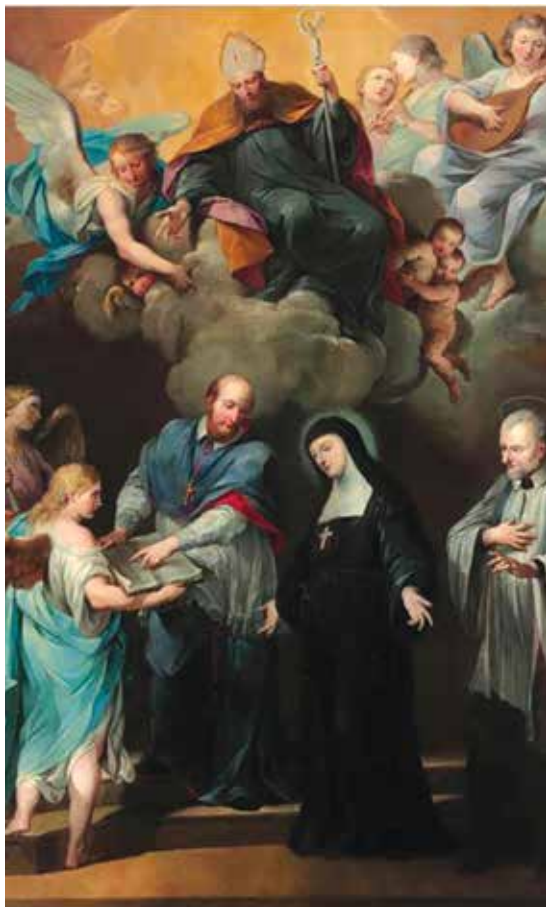
Francesco Vellani, San Francesco di Sales e San Vincenzo de' Paoli presentano le Regole della Visitazione alla Beata Giovanna di Chantal (1751 circa)

Percorrendo le sale espositive è stato possibile riconoscere l'immagine e gli episodi della vita, il carisma e le attività benefiche del Santo francese che segnò profondamente, in modo completo, “come apostolo della carità”, un momento della vita sociale e clericale della Francia del XVII secolo, contrassegnata da miseria e guerre.