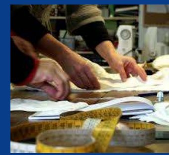
Il corso (a sx) e alcuni momenti della sfilata (a dx)