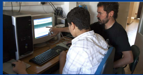
Progetto MI-X GIOVANI a Milano