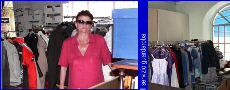
Il servizio guardaroba