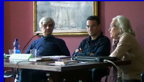
18/04/2018 i relatori intervenuti all'assemblea statutaria