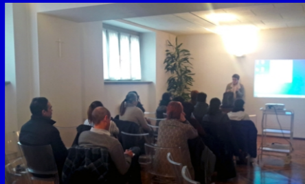
Il corso badanti