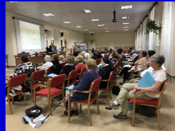
Due momenti della Scuola delle Presidenti del 25 e 26 maggio