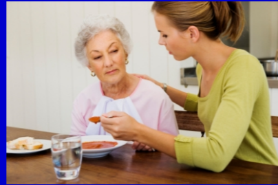
Una badante in azione