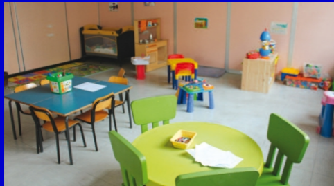
Lo Spazio Bimbi allestito dalla Porta della Solidarietà