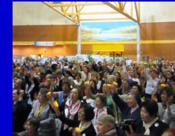
Panoramica fotografica di alcuni momenti delle celebrazioni per i 400 anni in Francia a Châtillon