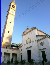
La parrocchia dei Santi Nazario e Celso a Paderno Dugnano