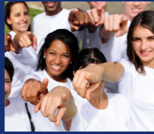
Unisciti a noi!