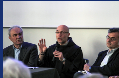
Assemblea regionale 2016