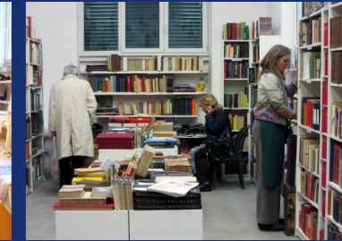
La fiera di via Ariberto dei GVV